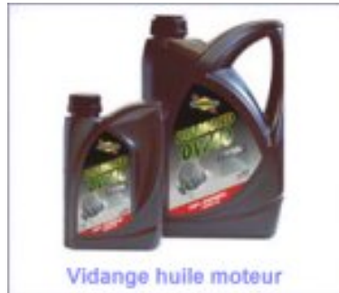
Vidange huile moteur