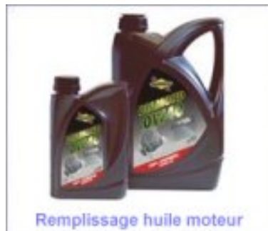
Remplissage huile moteur