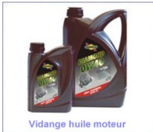
Vidange huile moteur