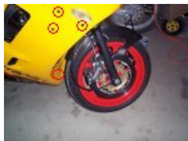
démontage du sabot