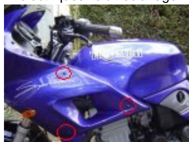
devisser l'ensemble de la tête de fourche