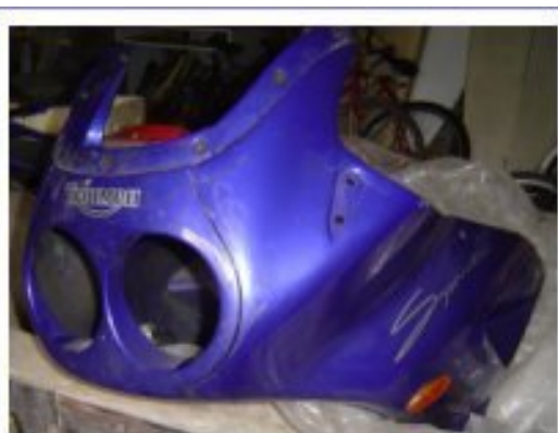
Démontage carénage avant