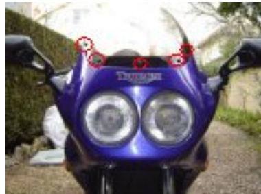
mettre la bulle