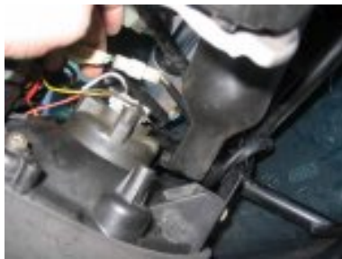
brancher les connecteurs électriques lié à l'éclairage