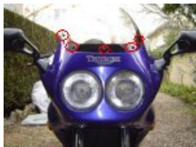
retirer la bulle