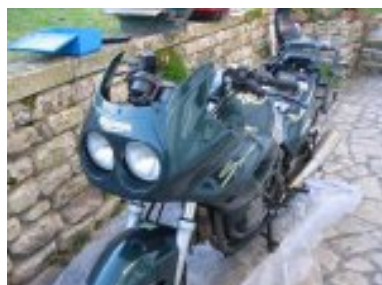
déposer les 2 clignotants avant