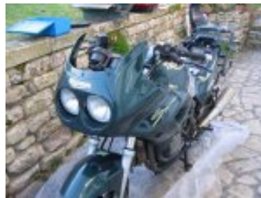
poser les 2 clignotants avant