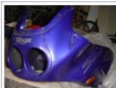
Remontage carénage avant