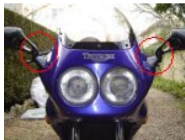
retirer les retroviseurs