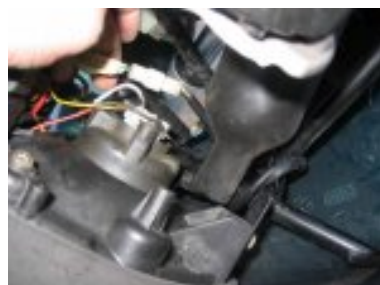
débrancher connecteurs électriques lié à l'éclairage