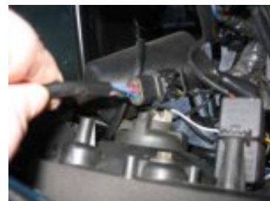
débrancher connecteurs électriques des deux clignotants avant