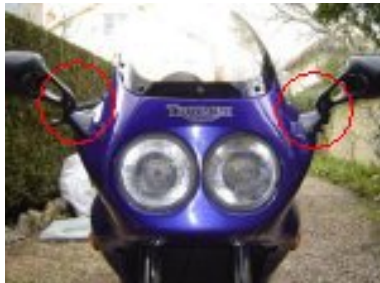
mettre les retroviseurs