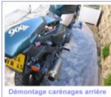
Démontage carénages arrière