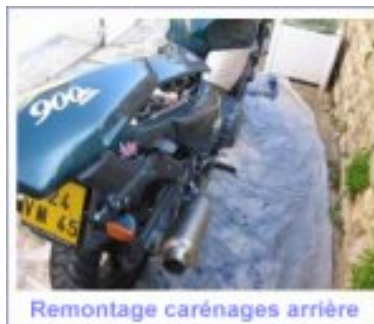
Remontage carénages arrière