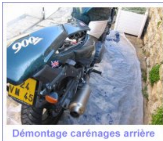
Démontage carénages arrière