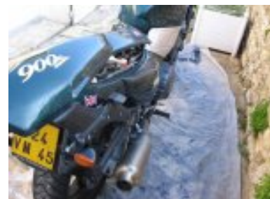
désserage fixations sur caches lateraux vis + clips