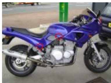
reclipser les caches lateraux