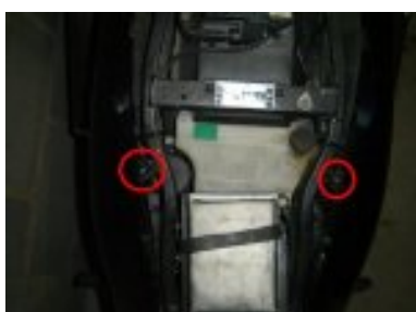
dévisser vis interieur caches lateraux