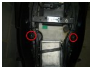
revisser vis interieur caches lateraux