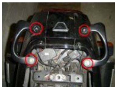
remontage des deux poignées Ar