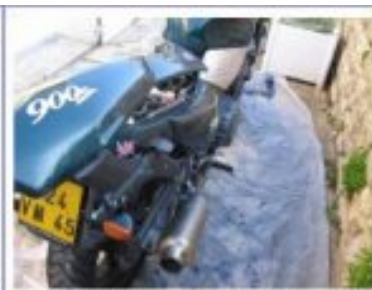
Remontage carénages arrière