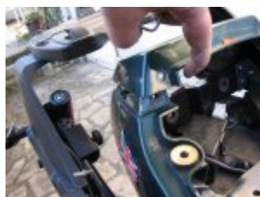
resserage fixations sur caches lateraux vis + clips