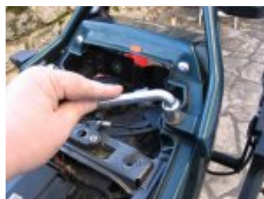
remontage la poignée centrale ar